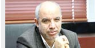
میراث فرهنگی و صنایع دستی از محل صندوق توسعه ملی با اعطای بانک‌های سپه، پارسیان و گردشگری تأمین شود.

سازمان برنامه بودجه کشور امضاء کردند. بر اساس تفاهم نامه امضاء شده قرار است منابع مورد نیاز پروژه‌های در حوزه‌های گردشگری، سازمان‌های برنامه بودجه کشور و گردشگری، میراث فرهنگی و صنایع دستی و رئیس صندوق توسعه ملی کشور در محل برای اجرای طرح اشتغال فراگیر در بخش گردشگری میراث فرهنگی و صنایع دستی تفاهم نامه همکاری مشترک بین رؤسای