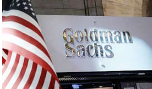
طبق اعلام گلدمن ساکز چشم‌انداز مالی ایالات متحده خوب نیست و ممکن است در هنگام رکود اقتصادی بعدی امنیت اقتصادی

ناخالص ملی است)، به ۱.۲۵ تریلیون دلار (یا ۵۵ درصد تولید ناخالص ملی) خواهد رسید و ای‌ان‌ک پیش‌بینی می‌کند که این رقم تا سال ۲۰۲۸ به ۲.۰۵ تریلیون دلار (یا ۷۰ درصد تولید ناخالص ملی) ارتقا پیدا کند. جان هاتزیوس، اقتصاددان ارشد بانک گلدمن ساکز، نوشت: احتمالاً بالا رفتن سطح کسری بودجه و بدهی، فشار بالا برنده‌ای به نرخ بهره