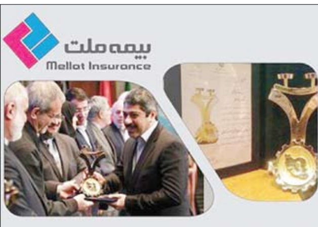
مصرف کنندگان و تولیدکنندگان، ۷۹۳ شرکت و بنگاه برای حضور در این همایش کارشناسی در شاخص های قیمت و کیفیت، ثبت نام کردند؛ ۴۷۸ شرکت در کمیته های

استفاده از کالاها و خدمات واحدهای دارای گواهینامه و تنдіس و افزایش رقابت سازنده بین تولیدکنندگان و ارائه دهندگان خدمات در جهت ارائه محصولات مرغوب و با کیفیت در روز ملی حمایت از حقوق مصرف کنندگان برگزار می شود. شرکتهای برتر تنдіس ها و گواهینامه های خود را از وزیر صنعت، معدن و تجارت دریافت کردند و بیمه ملت موفق به دریافت «گواهینامه و تنдіس طلایی رعایت حقوق مصرف کنندگان» شد. فرآیند ارزیابی بنگاه های اقتصادی برای دریافت این گواهینامه بر اساس ۴ شاخص کلی قیمت، کیفیت، خدمات پس از فروش و رضایت مشتری و با حضور مدیران ذی ربط سازمان حمایت و همچنین نمایندگان نهادهای مربوطه صورت گرفته است. طی ممیزی به عمل آمده توسط سازمان حمایت از حقوق