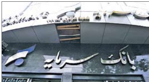
سیایت بانک سرمایه به نشانی www.sbsnki.ir مراجعه کرده و تماس حاصل نمایند. شماره ۴۲۷۳