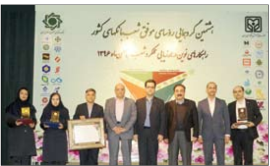
دانش، تقویت مهارت های علمی و حرفه ای علوم بانکداری، انتقال از زحمات و تلاش های رؤسای

شبکه بانکی و دستیابی به آخرین فناوری ها و نوآوری های عرصه بانکی و دیدگاه های مدیران ارشد نظام بانکی کشور، بر گزار می شود. در هشتمین گردهمایی رؤسای موفق شعب بانک های کشور که با حضور اعضای هیئت مدیره و مدیران شبکه بانکی برگزار شد از رؤسای شعب موفق بانک توسعه تعاون تقدیر به عمل آمد. گفتنی است در این مراسم که هر ساله به همت بانک مرکزی برگزار می گردد از رؤسای شعب برتر بانک در کل کشور با اهدای لوح تقدیر