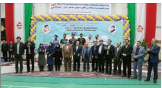
و شرکت های تابعه گروه مالی دی در دو بخش ورزش های تیمی و انفرادی

بر گزار شد. بر اساس این گزارش در اختتامیه این جشنواره، تیم های فوتسال «نیروگاه دماوند» و «دی نوین» از میان ۱۵ تیم و چهار گروه تیمی حاضر در این دوره از رقابت ها در مرحله نهایی با یکدیگر به رقابت پرداختند که در نهایت تیم فوتسال «نیروگاه دماوند» با برتری مقابل «دی نوین» به مقام قهرمانی مسابقات فوتسال دست یافت. همچنین در دیدار رده بندی بین دو تیم «شهید اکبری»