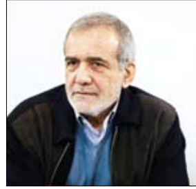
نایب رییس مجلس گفت: درباره سپرده گذاران شرکت تعاونی اعتباری ولیعصر (عج) رباط کریم و بهارستان مقرر شد که سپرده‌های آنها تا ۵۰ میلیون تومان پرداخت شود. به گزارش ایپنا، مسعود پزشکیان در تشریح آخرین نشست نمایندگان سران سه قوه برای بررسی مشکلات مؤسسات مالی و اعتباری، گفت: مقرر شده که هیات‌های تسویه شکل بگیرد که یکی از

ربوی می‌شود که اسباب نگرانی مراجع و مجلس خبرگان را فراهم می‌کند. وی افزود: بانک مهر اقتصاد یکی از سرآمدترین بانک‌ها در حوزه پیاده‌سازی بانکداری بدون ریاست و اقدامات قابل توجهی در این عرصه صورت داده است لذا امیدوارم در سایر بانک‌ها نیز شاهدین حساسیت و جدیت در اجرای بانکداری اسلامی باشیم. آیت الله فرحانی خاطر نشان کرد: ان شا الله بانک مهر اقتصاد استان خوزستان در جهت اقتصاد مقاومتی و مدیریت منابع در ایجاد اشتغال پایدار اثر گذار باشد.