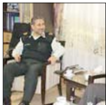
سردار مهدی محمودی در دیدار با حسن میرزا عبدالهی ها مدیر شعب استان قزوین بر نقش مؤثر بانک ها در ایجاد امنیت و پیشگیری از وقوع جرم در جامعه تاکید کرد و گفت: عملکرد شایسته بانک قرض الحسنه مهر ایران در کنترل و مدیریت انواع ریسک های بانکی و همچنین آمارهای مربوط به کفایت سرمایه، نسبت مصارف به منابع و میزان مطالبات، نشان می دهد که امنیت اقتصادی سپرده گذاران این بانک در بالاترین سطح ممکن قرار دارد. فرمانده نیروی انتظامی استان قزوین ضمن تقدیر از مساعدت های بانک قرض الحسنه مهر ایران در ارائه تسهیلات به کارکنان مجموعه نیروی انتظامی استان بیان داشت: رفتار سپرده گذاران در قبال دریافت سود

بانکی تغییر کرده است و با مفهوم ریسک آشنا شده اند؛ به همین علت افراد بیشتری با استقبال از سید محصولات بانک های قرض الحسنه حاضرند سپرده های خود را به شعب این بانک انتقال دهند. سردار مهدی محمودی افزود: امنیت اولویت اصلی پلیس استان قزوین است و این امر بدون همکاری سایر دستگاه ها محقق نخواهد شد. در ادامه، حسن میرزا عبدالهی ها نیز ضمن تشریح دستاوردها و اقدامات بانک قرض الحسنه مهر ایران در استان قزوین گفت: این بانک با ارائه خدمات در حوزه های بهبود معیشت، سلامت و درمان، از دواچ جوانان و اشتغالزایی در تلاش است تا محورهای تحقق اقتصاد مقاومتی را تسریع کند.