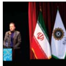
تلاش می کنند شایسته تقدیر هستند. به گفته وی بانک مسکن همیشه به عنوان یک بانک دولتی در کنار آن بزرگواران در راستای عمل به مسوولیت اجتماعی و از طریق ارائه خدمات بانکداری الکترونیک موفق به راه اندازی زیرساخت یکپارچه، متمرکز و هوشمند گفتری به منظور سهولت کاربری روشندان عزیز در استفاده از خدمات در گاه ها و ابزارهای پرداخت گردیده است و همچنین قابلیت ارائه سرویس های کلامی در درگاه های مختلف بانکداری الکترونیک را فراهم نموده است، که از مزایای استفاده از آن، تسهیل خدمات بانکی به صورت مستقل و بدون نیاز به همراه، برای استفاده کنندگان از این سامانه می باشد.