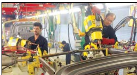
ارزی به منظور خرید ماشین آلات جدید از اروپا با شرکت کاله بود که برای تولید یک محصول جدید صادراتی در نظر گرفته شده است. گرجستانی

ادعان داشت: مقصد حواله های ارزی ما برای خرید این ماشین آلات، اروپاست و بناس تا پایان ماه جاری یک LC وارداتی به مبلغ بیش از ۲۶ میلیون یورو به این منظور گشایش پیدا کند. وی خاطر نشان کرد این LC وارداتی در نوع خود بزرگترین گشایش اعتبار اسنادی وارداتی بین شعب شهرستان بانک توسعه صادرات در سال ۱۳۹۶ است؛ پیرو گشایش این LC، طبق مصوبه هیات مدیره بانک توسعه صادرات، تسهیلاتی به