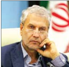
فرابند رسمی کردن مشاغل غیر رسمی کمک کنند.

گروه‌های اجتماعی بدون بیمه تمرکز کنیم. به گزارش اقتصاد آنلاین به نقل از فارس، وی ادامه داد: صندوق بیمه روستاییان و عشایر در بحث بیمه کردن ۶ میلیون نفر محور کار خواهد بود و گروه‌های اجتماعی به عنوان مثال دستفروشان که در برخی شهرها مشغول به کارند در حالی که بیمه ندارند یا کولبران که فاقد بیمه بوده‌اند در گروه افراد فاقد بیمه خواهند